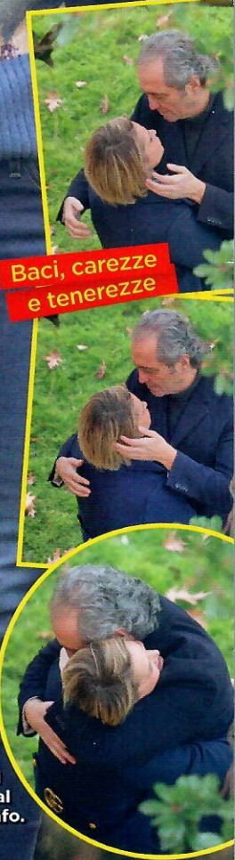
Baci, carezze e tenerezze

Mai visti così: Simona Ventura e il fidanzato Giovanni Terzi sorpresi dal nostro fotografo.